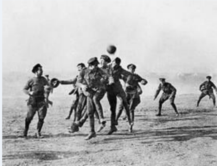
Tregua di Natale del 1914