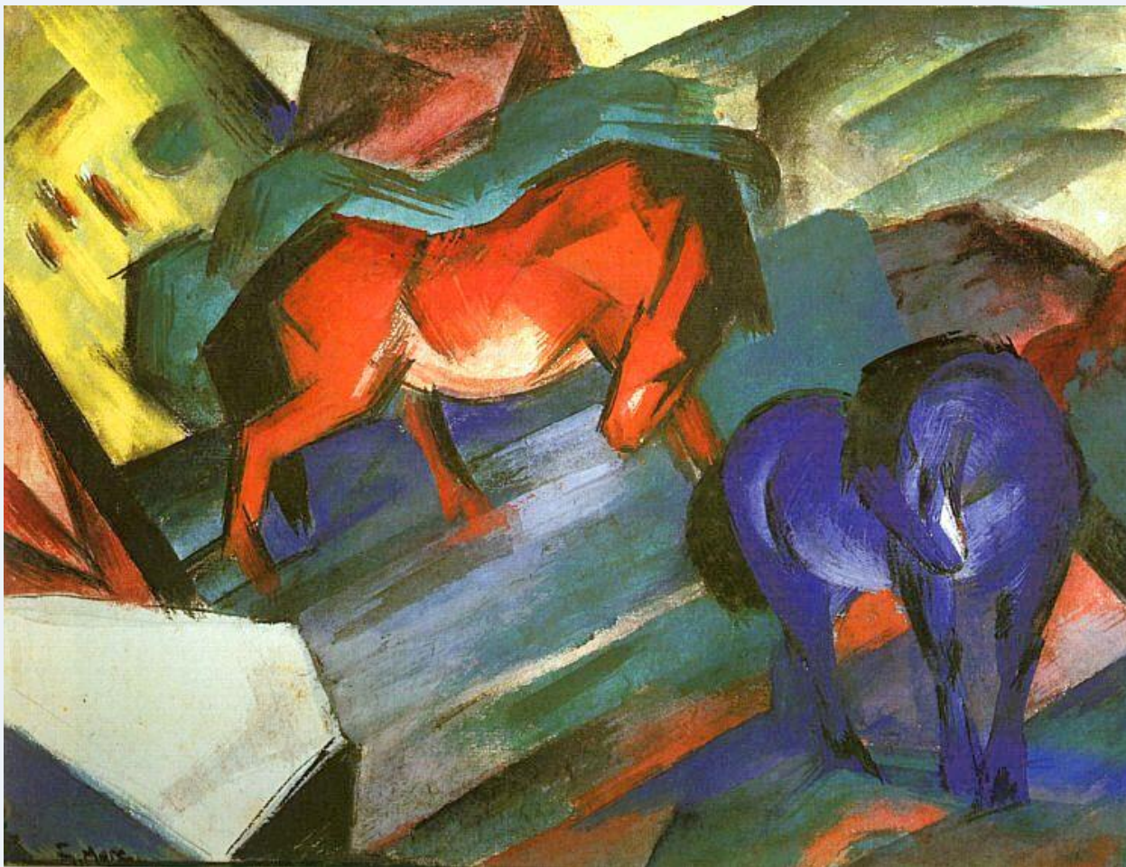
Franz Marc, Cavalli rossi e blu, 1913

Si arruolò come volontario. Morì nel 1916, a Verdun.