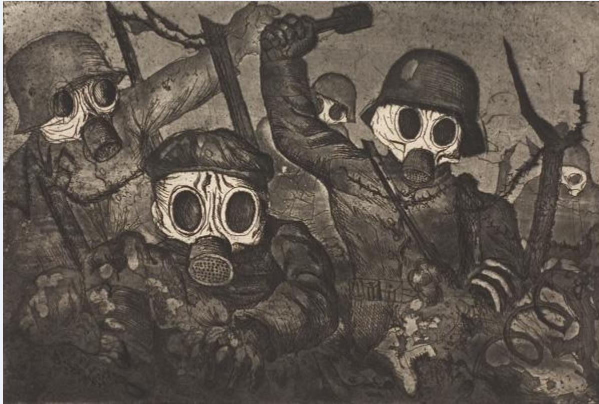
1932 "La guerra"

Volontario. Combatté sia sul fronte occidentale che sul fronte orientale; fu ferito e decorato più volte. I nazisti bruciarono alcune sue opere considerandole arte degenerata.